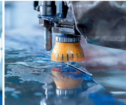
Fournir des matériaux parfaitement transformés nécessite un contrôle approfondi de la qualité (à gauche). Dans le cadre de nos nombreux services, nous proposons la technologie avancée de découpe au jet d'eau (ci-dessus).

« Fournir des produits fiables et de qualité supérieure, des services et des solutions avec précision et un rapport coût-bénéfice très élevé. »